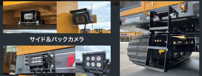
サイド&バックカメラ

点検・メンテナンス時の車両昇降に使用するステップが改良され従来機よりも昇降がより容易になりました。